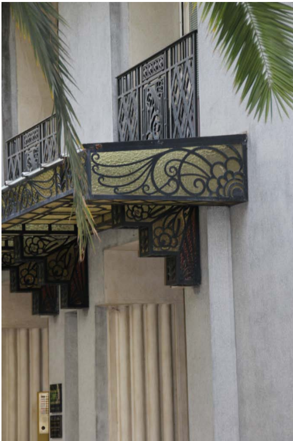
Palais Marie, Nice, détail