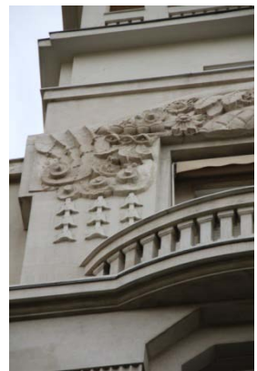
Palais Marie, Nice