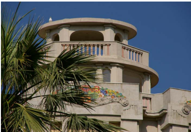
La Rotonde, Nice, détail

L'une de ses premières constructions à Nice est le Palais Adly, un hôtel transformé en copropriété avant son achèvement.